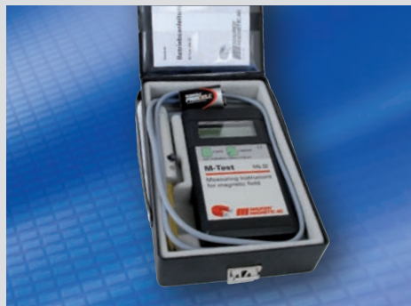
Lieferumfang ohne Optionen